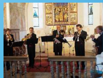
Quintett der Grassauer Blechbläser

Info: Die Veranstaltung findet bei jeder Witterung statt. Eintritt: 18,- € (Tickets: Tourist-Info Schleching) - Restkarten an der Abendkasse. Kontakt: Tourist-Info Schleching, Schulstraße 4, Telefon 08649 220.